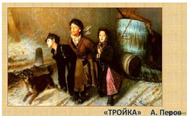
«ТРОЙКА» А. Перов red

8. Напиши название и автора картины _____